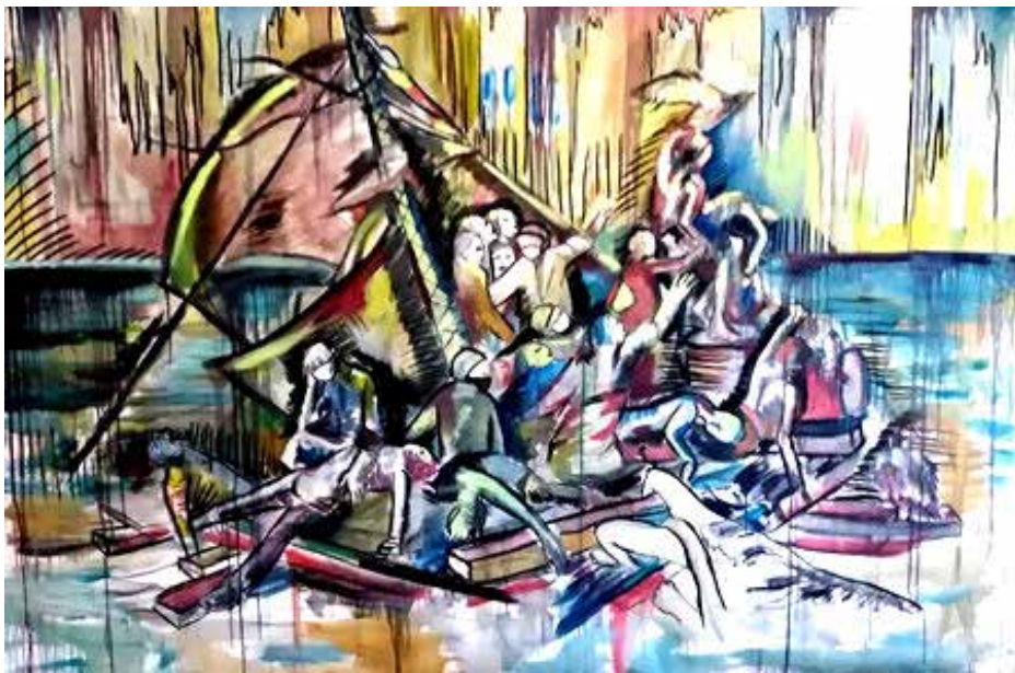
Kim NEZZAR. "Le radeau de la méduse" 2020, Huile Acrylique sur toile.

https://fr.wikipedia.org/wiki/Le_Radeau_de_La_Méduse