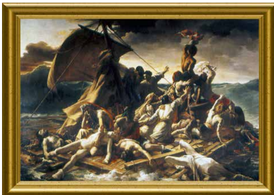
Théodore GÉRICAULT, Radeau de la Méduse, 1818-1819, peinture à l'huile sur toile de 7,16 de 4,91 m. Musée du Louvre :

https://www.louvre.fr/oeuvre-notices/le-radeau-de-la-meduse